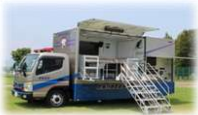
起震車に乗って震度の体験