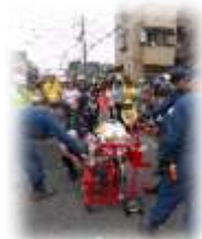
可搬ポンプの試運転