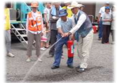
水消火器による消火作業訓練